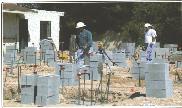
Construction started on February 4, 2003 by the Korte Company