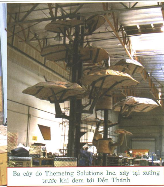
Ba cây do Themeing Solutions Inc. xây tại xưởng trước khi đem tới Đền Thánh