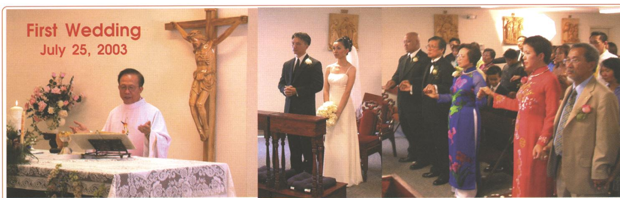
First Wedding July 25, 2003

Đền Thánh Mẹ, nhà của ta. No place like home!