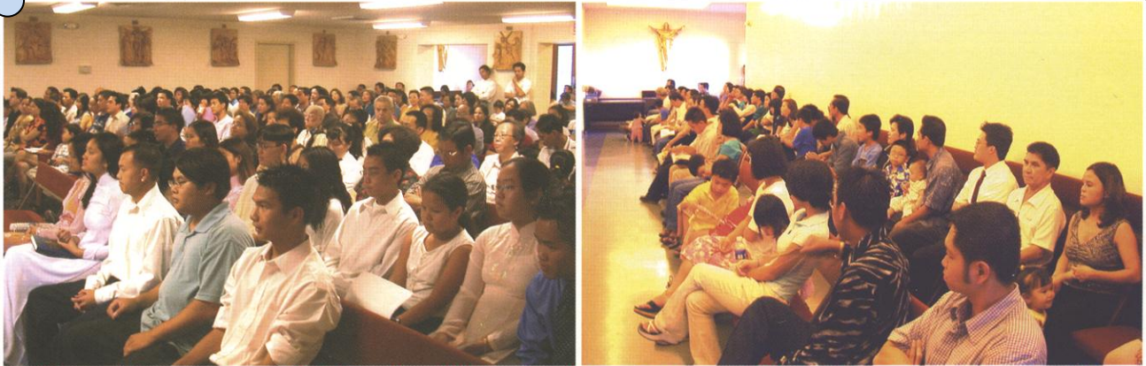
Trong nhà nguyện hơn 200 chỗ ngồi mà không đủ, phải ngồi thêm ngoài hành lang * Inside the chapel